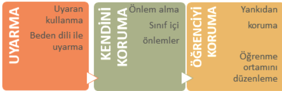
Uygulama ve Davranışlar Temasının Kategorisi ve Kodları